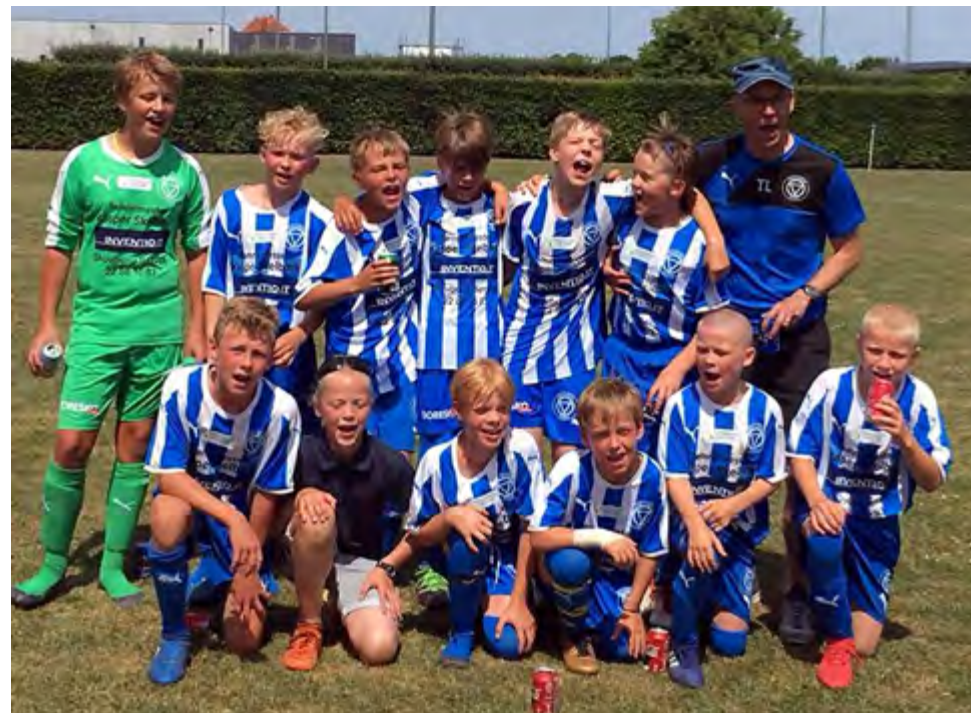
Glade spillere på det daværende U12-hold, da det i juni havde sikret sig førstepladsen i række 2.

Alt i alt kan han altså glæde sig over, at KFUM i dag råder over fem hold i Østrækkerne, der tidligere hed 2. og 3. division under SBU.