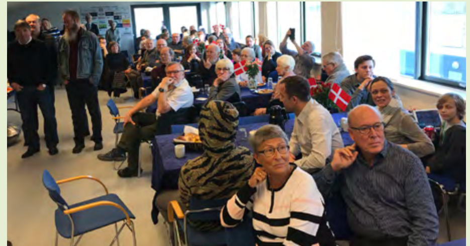
Det var én af de dage, hvor det indimellem kneb med pladsen på førstesalen.