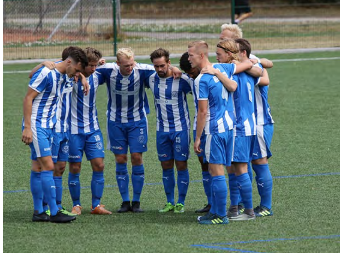
Så gælder det total indsats og koncentration i de næste 90 minutter

- Vi har set lovende takter fra de nye, og kampen om pladserne er blevet